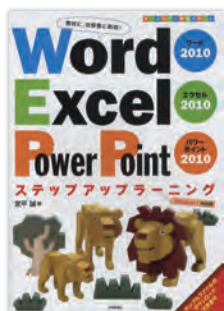
Word Excel PowerPoint ステップアップラーニング (著:定平誠 刊:技術評論社)